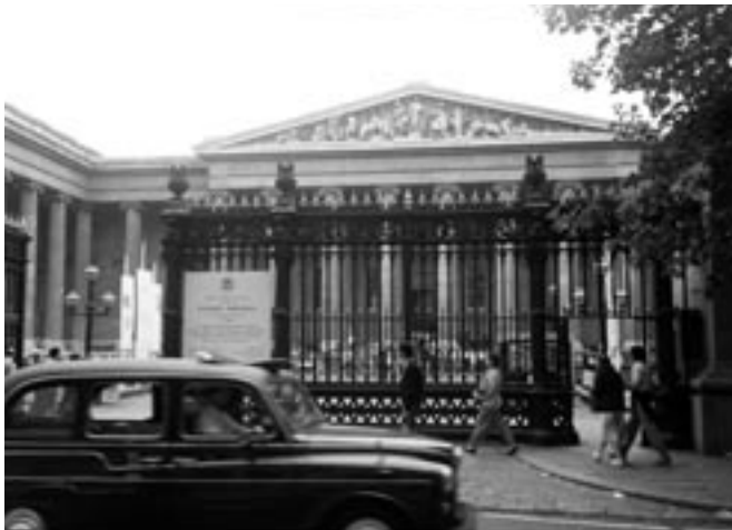
The British Museum (英国, ロンドン)