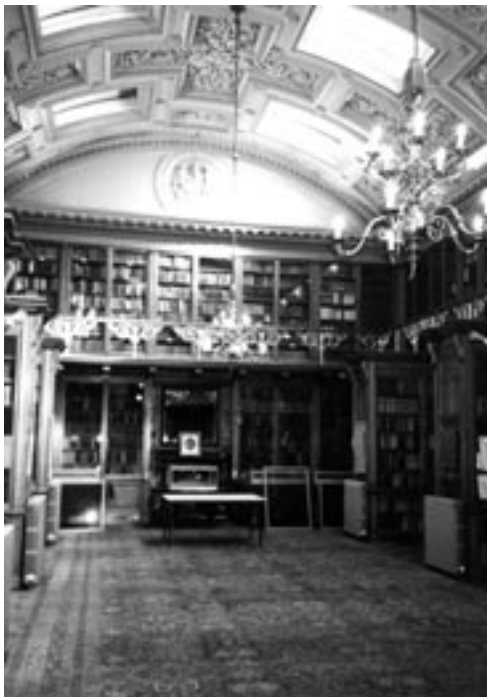
Royal College of Physicians of Edinburgh, Library : Reading Room (英国, エジンバラ)