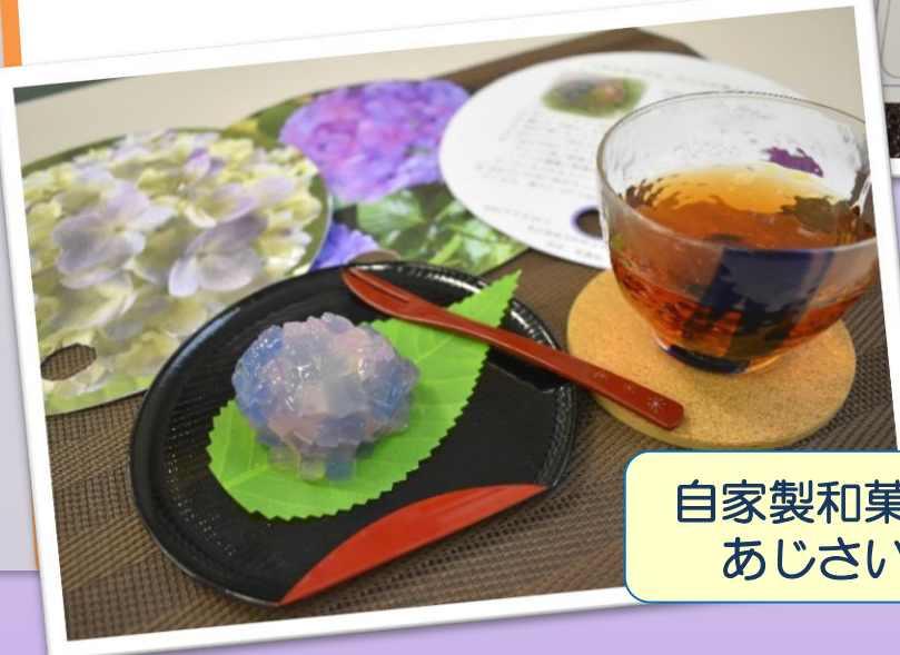
自家製和菓子 あじさい