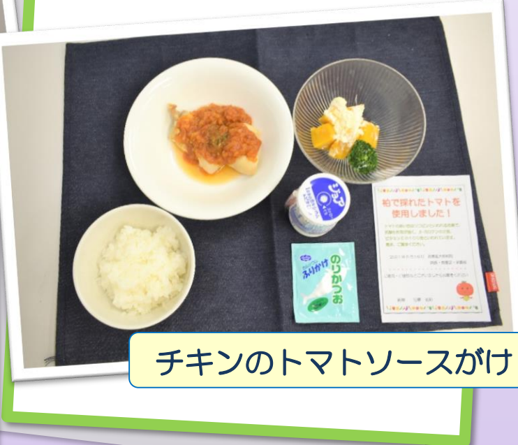
チキンのトマトソースがけ