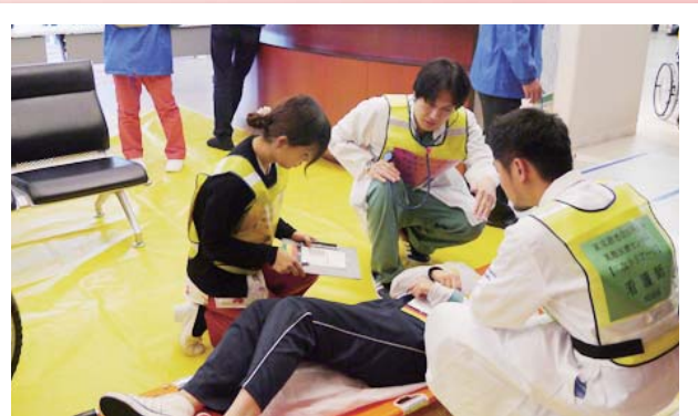
●トリアージ訓練様子

本訓練開催にあたり、葛飾区保健所並びに葛飾区医師会のみなさまを始め、各関係機関に感謝を申し上げるとともに、今後も地域と共生し、進化・創造し続ける病院として、また、大規模災害発生の際には、災害拠点病院として地域に貢献できるよう、よりいっそう努めるべく、邁進していく所存です。