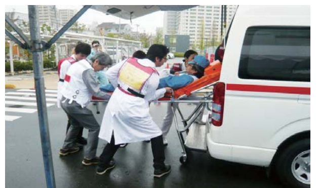
●広域搬送訓練様子